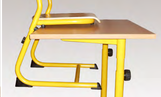
APPUI SUR TABLE