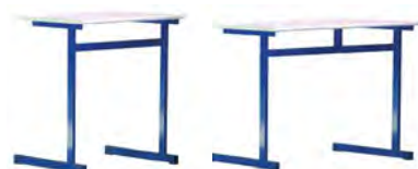
TABLE STRUCTURE SOUDÉE MONOPLACE - TAILLES 4/5/6/7 TABLE STRUCTURE SOUDÉE BIPLACE - TAILLES 4/5/6/7

MELAMINE PVC - M STRATIFIÉ ALAÏSÉ BOIS - S