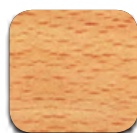
HÊTRE CLAIR (350)