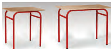
TABLE MONOPLACE - TAILLES 4/5/6/7 TABLE BIPLACE - TAILLES 4/5/6/7

MELAMINE PVC - M STRATIFIÉ ALAÏSÉ BOIS - S