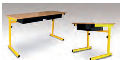
TABLE RÉGLABLE EN HAUTEUR MONOPLACE - TAILLES 4/5/6 TABLE RÉGLABLE EN HAUTEUR BIPLACE - TAILLES 4/5/6

(CASIERS VENDUS SÉPARÉMENT) MELAMINE PVC - M STRATIFIÉ ALAÏSÉ BOIS - S