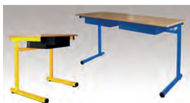
TABLE MONOPLACE FIXE - TAILLES 4/5/6/7 TABLE BIPLACE FIXE - TAILLES 4/5/6/7

MELAMINE PVC - M STRATIFIÉ ALAÏSÉ BOIS - S