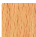
HÊTRE NATUREL VERNIS