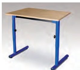
TABLE MONOPLACE TUBE ROND RÉGLABLE EN HAUTEUR - TAILLES 4 À 6 TABLE BIPLACE TUBE ROND RÉGLABLE EN HAUTEUR - TAILLES 4 À 6

MELAMINE ABS 2 mm - M STRATIFIÉ ALAÏSÉ BOIS ou STRATIFIÉ ABS 2 mm - S