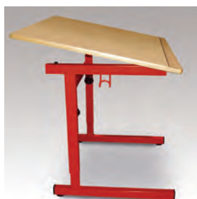
TABLE RÉGLABLE EN HAUTEUR DE 64 À 82 cm POUR ENFANT À MOBILITÉ RÉDUITE

MELAMINE ABS 2 mm - M STRATIFIÉ ALAÏSÉ BOIS ou STRATIFIÉ ABS 2 mm - S