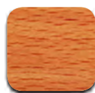
HÊTRE FONCÉ (563)