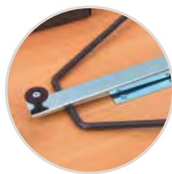
Système de fermeture autobloquant