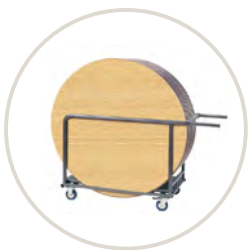
Chariot de transport

GRAND DIAMÈTRE - GRANDE STABILITÉ - ROBUSTE & PRATIQUE