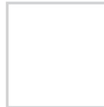
Blanc - WHI