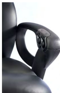
Réglage du siège par des boutons-poussoirs sur les accoudoirs.