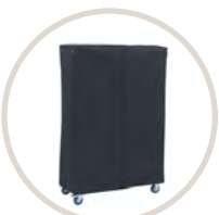
Housse pour chariot