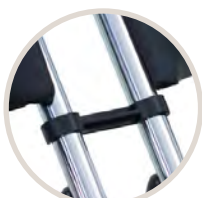
Pièce de liaison