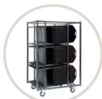
Chariot de transport