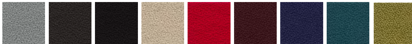
Gris clair 0015

Ignifuge M1 - 100% PL Trevira - Résistant à la lumière.