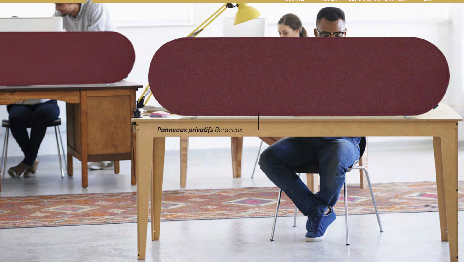
Panneaux privatifs Bordeaux.