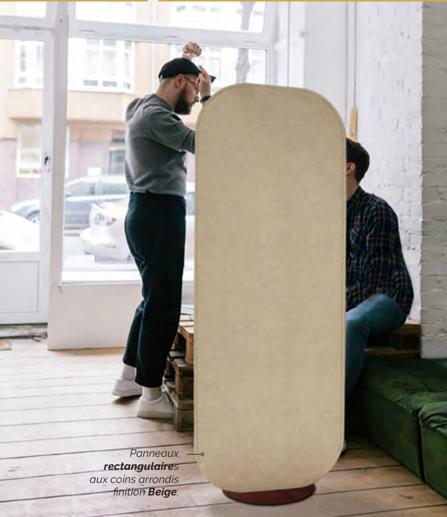
Panneaux rectangulaires aux coins arrondis finition Beige .