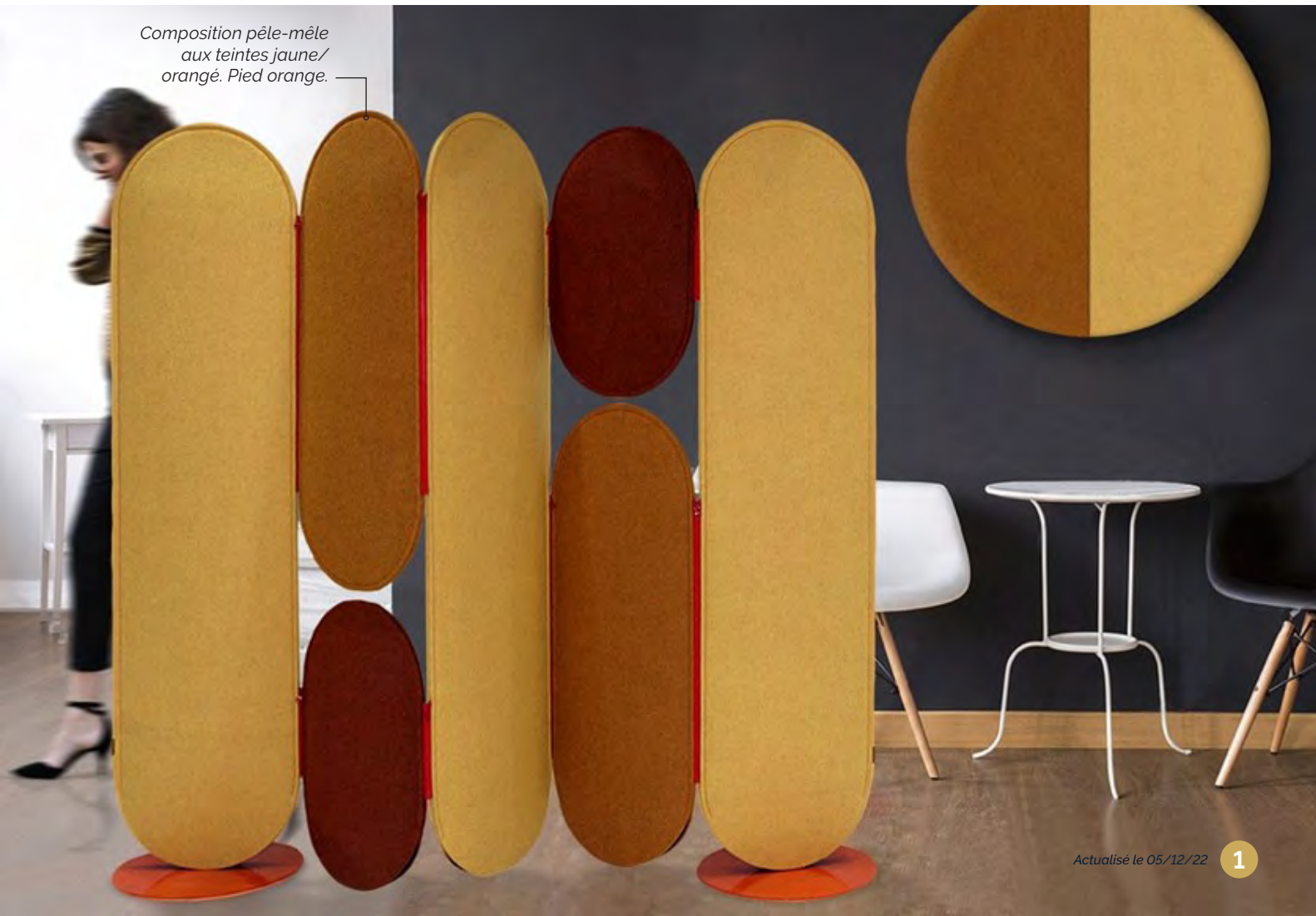
Composition pêle-mêle aux teintes jaune/ orangé. Pied orange.