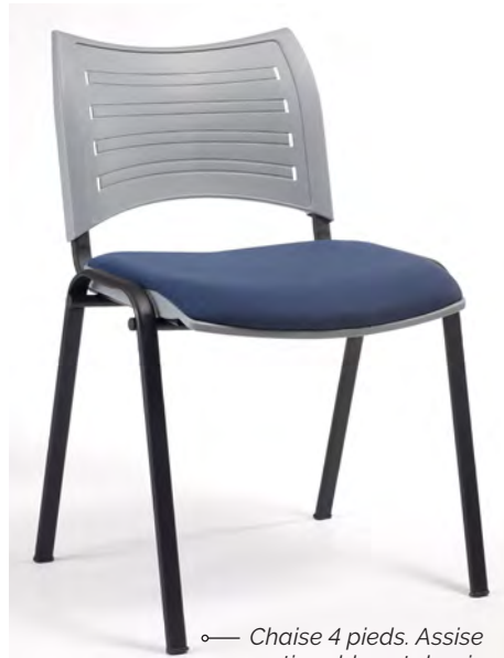
Chaise 4 pieds. Assise en tissu bleu et dossier polypropylène gris . Structure Noir .