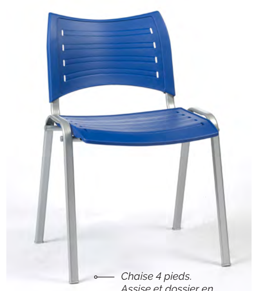
Chaise 4 pieds. Assise et dossier en polypropylène bleu . Structure aluminium (en option).