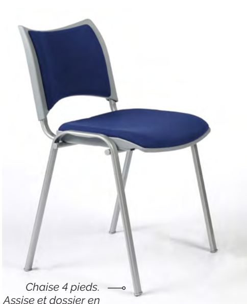
Chaise 4 pieds. Assise et dossier en tissu bleu . Structure aluminium (en option).