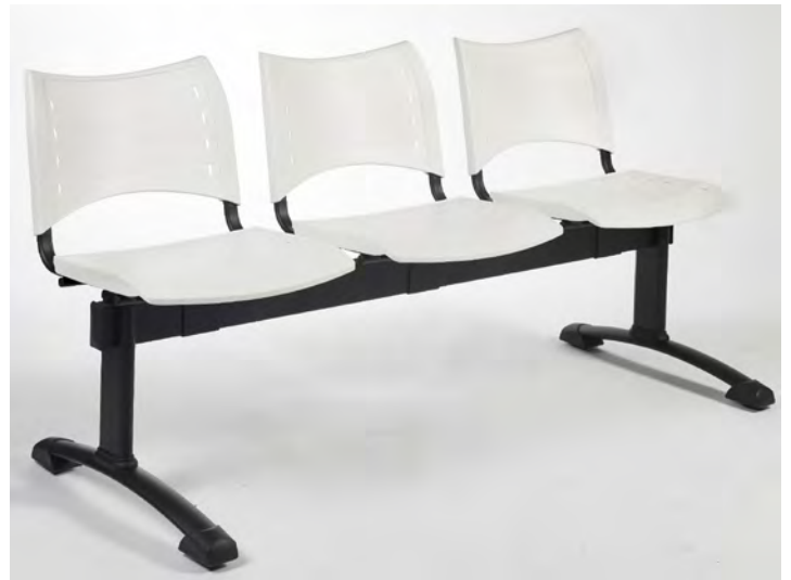
— Siège sur poutre 3 places . Assise et dossier en polypropylène blanc .