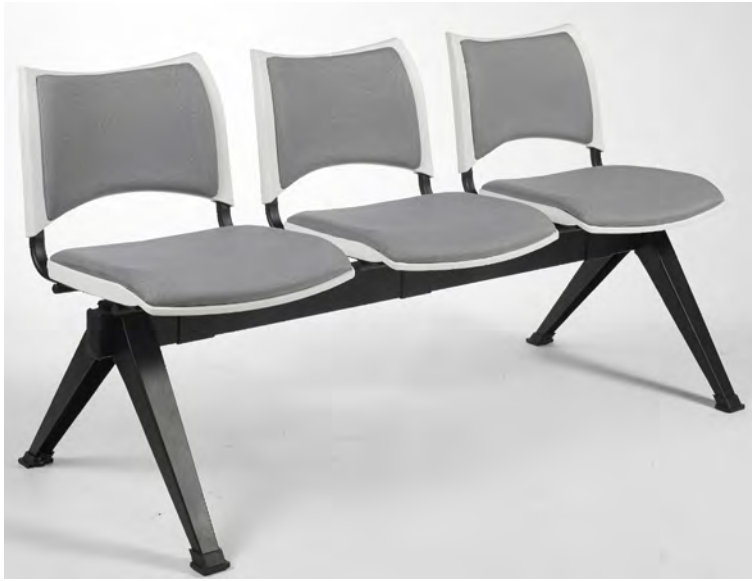
— Siège sur poutre 3 places . Assise et dossier tissu gris . Pieds pyramidales noirs (en option).