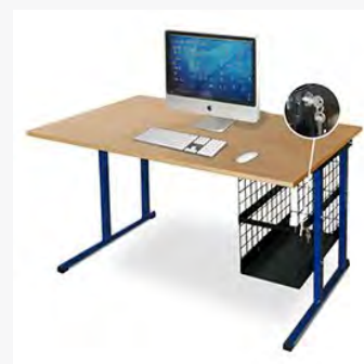
Postes info. Rousseau