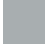
Aluminium RAL 9006