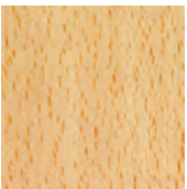
Hêtre naturel verniss 350