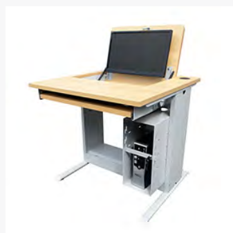
Postes info. Hugo