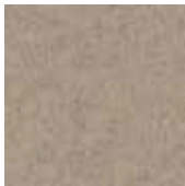
Beige clair T7K