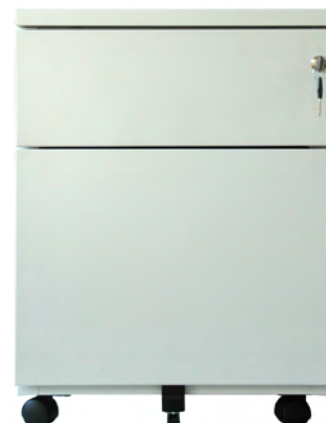
caisson 1 tiroir + DS - réf. CR2T