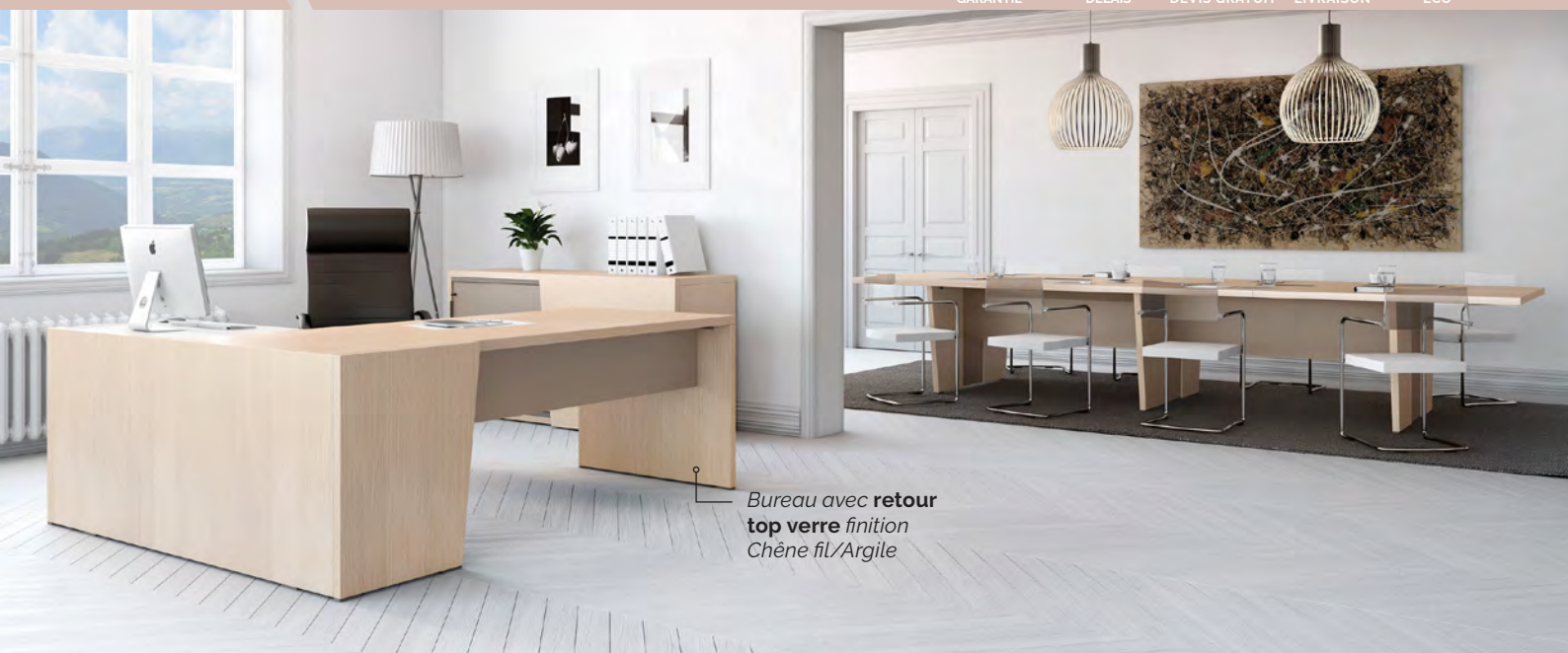
Bureau avec retour top verre finition Chêne fil/Argile