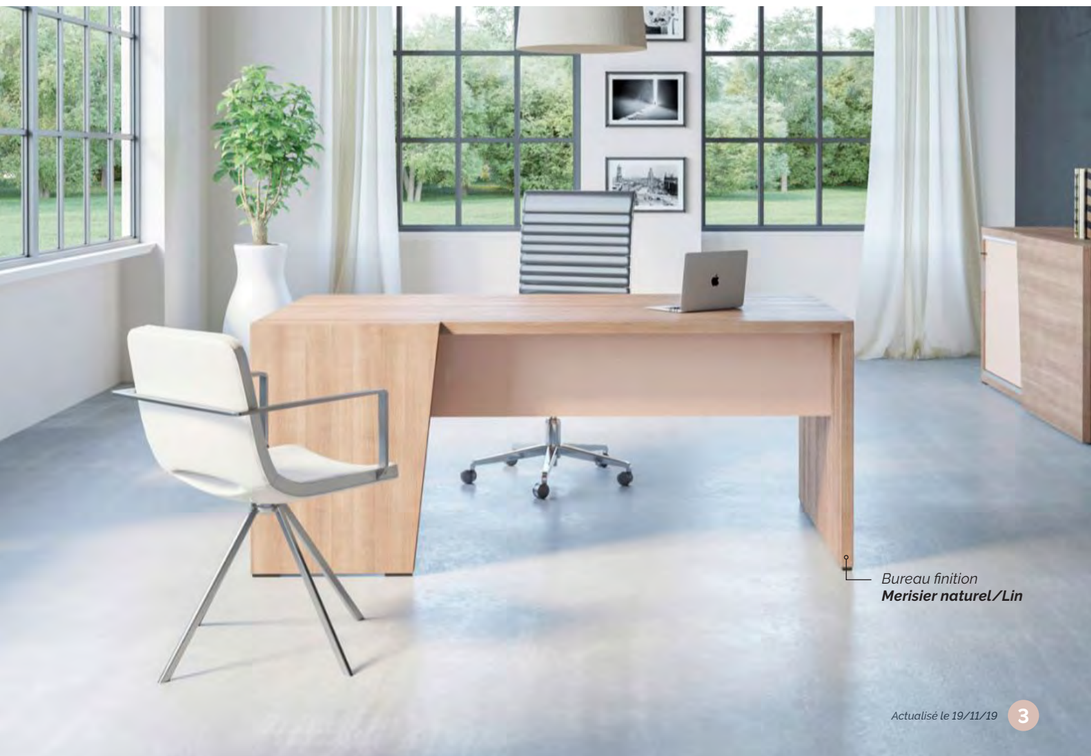
Bureau finition Merisier naturel/Lin