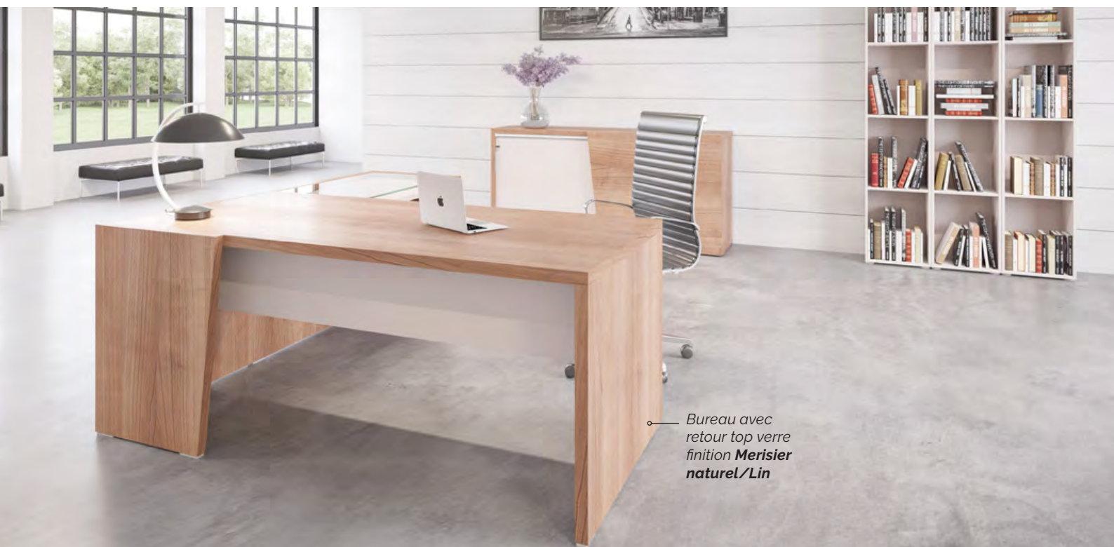
Bureau avec retour top verre finition Merisier naturel /Lin

Brenva, un ensemble de direction chaleureux dont le style souligne un tempérament dynamique et entreprenant. Brenva apporte une touche architecturale à votre ensemble de direction avec un jeu parfait de matières, de lignes asymétriques et des pans en relief. Brenva constitue le bon compromis entre budget, qualité et design.