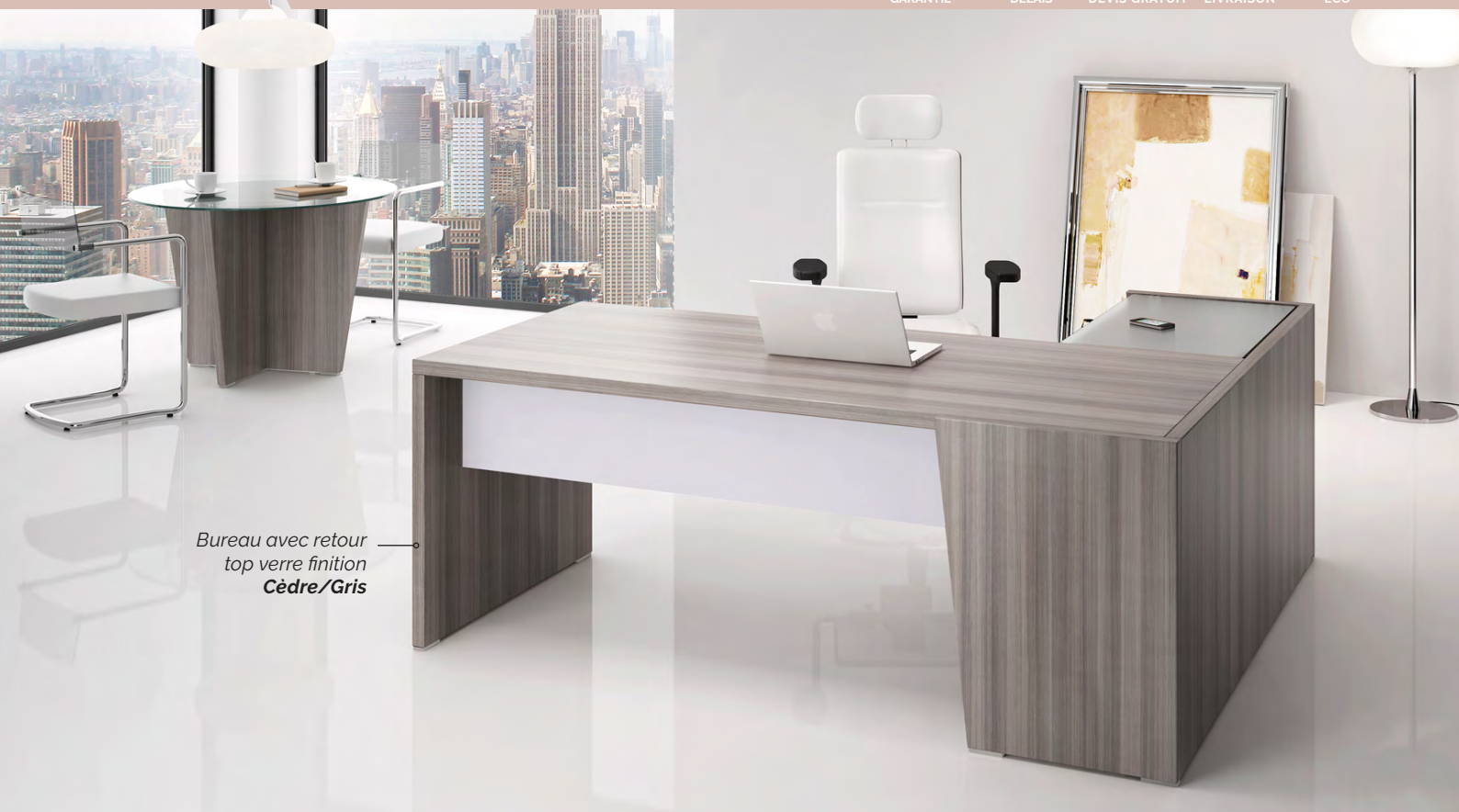
Bureau avec retour top verre finition Cèdre/Gris