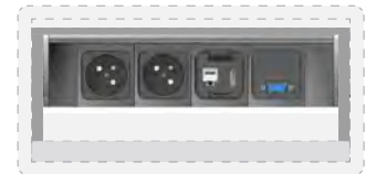
2 modules courant fort type France 1 module Kcoupleurs réseau RJ45 cat.6 1 module VGA, 1 module HDMI