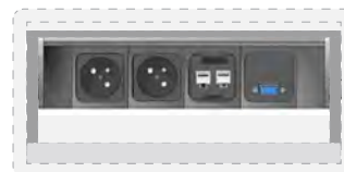
2 modules courant fort type France 1 module 2Kcoupleurs réseau RJ45 cat.6 1 module VGA