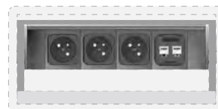
3 modules courant fort type France 1 module 2Kcoupleurs réseau RJ45 cat.6