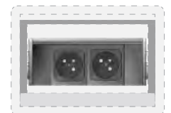
2 modules courant fort type France