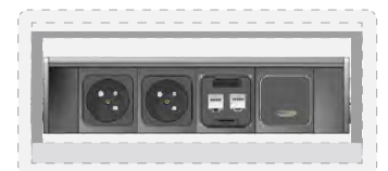
2 modules courant fort type France 1 module 2Kcoupleurs réseau RJ45 cat.6 1 module HDMI