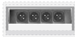
4 modules courant fort type France

Adaptable Sur tous types de plans de travail.