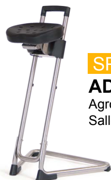
SPÉCIAL ADP Inox Agro alimentaire Salle humide