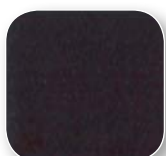
Noir - 33